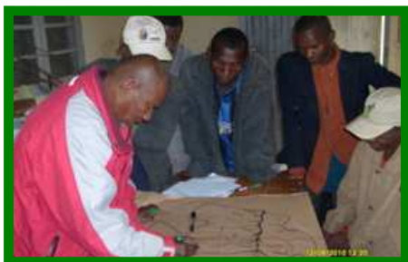
Equipe de recherche en plein travail à Analavory