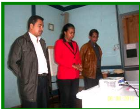
La Présidente de LIFE et les deux vice-présidents

L'insécurité alimentaire dans la Région de Vatovavy Fitovinany interpelle sept organisations : CEDII, CMP-Tandavanala, SAF/FJKM, VOARISOA Observatoire, COLDIS, Tiavo et Fiantso Madagascar. Elles ont mené un processus de développement organisationnel pour faire face à cette réalité locale.