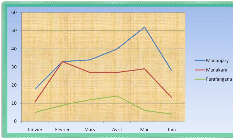
Evolution des cas traités au niveau des TAZ de janvier à juin 2010

Depuis juillet, plus de 100 cas de conflits ont été encore traités au niveau de la TAZ de Manakara.