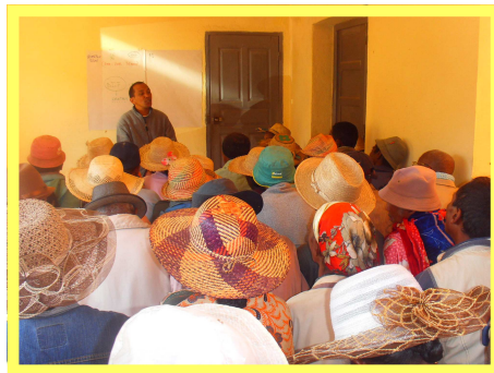
Ekipa Fiantso manentana mikasika ny fanatanterahana ny fanadihadiana

Zavatra efitra loha no tena niompanan'ny fanadihadiana dia ny famantarana ny satan'ny tany rehetra ao anatin'ilay kaominina, ny fomba fitantanana ny tany, ny fomba famahana ny olana ara-pizakan-tany