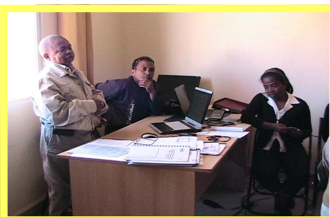
Ekipa fiantso manatanteraka ny tatitra

ka zavatra maro loha no navoitra isan'izany ny "arrêté ministériel 03-813 / 2010" mikasika ny fanomezana (dotations) ny amin'ny fampandehanana sy ny karaman'ny mpiasan'ny BIF sy ny mety ho fandraisan'anjaran'ny kaominina amin'ny